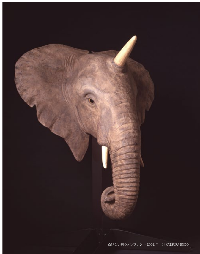
ぬけない刺のエレファント 2002年 © KATSURA ENDO