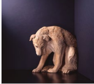
光の肖像 - すみっこのボンザ - 2011年