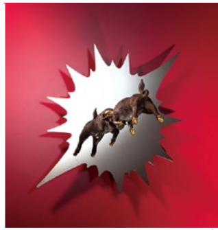
Fighting bull 2020年