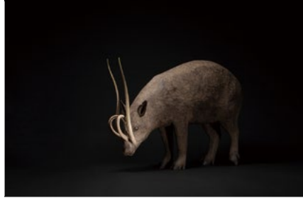
死に生ける獣 - Babirusa - 2016年