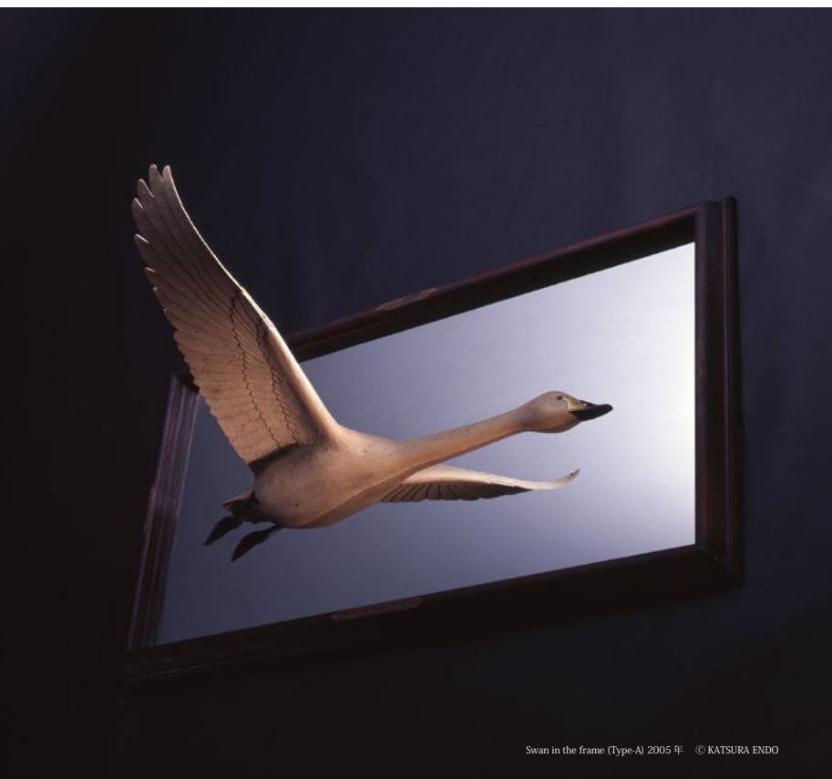
Swan in the frame (Type-A) 2005年 © KATSURA ENDO

〒389-0515 長野県東御市常田 505-1 ■ TEL 0268-62-3700 ■ 開館時間 9時～17時 (土曜 19時) ■ 入館料 高校生以上 500円 ■ 休館日 1/12、18、25 2/1、8、12、22、24