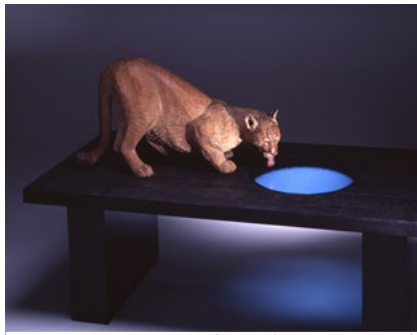
月夜のテーブル - Cougar - 2004年